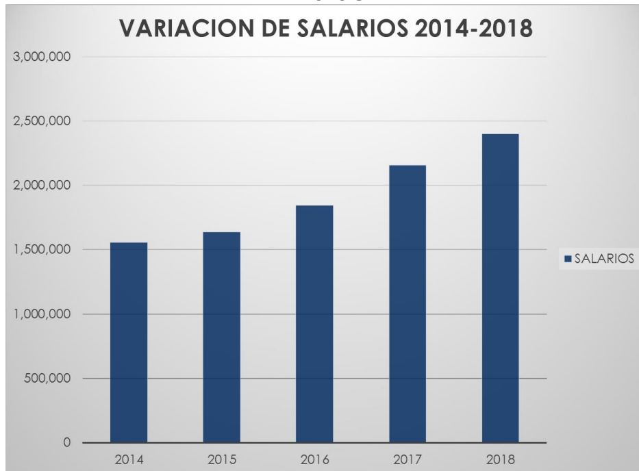
Gráfica de variación de salarios 2014-2018